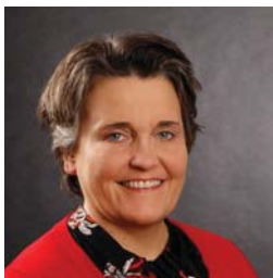
Ina große Beilage

Rechtspflegerin Amtsgericht Vechta 45 Jahre